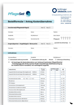
Bestellformular / Antrag Kostenübernahme